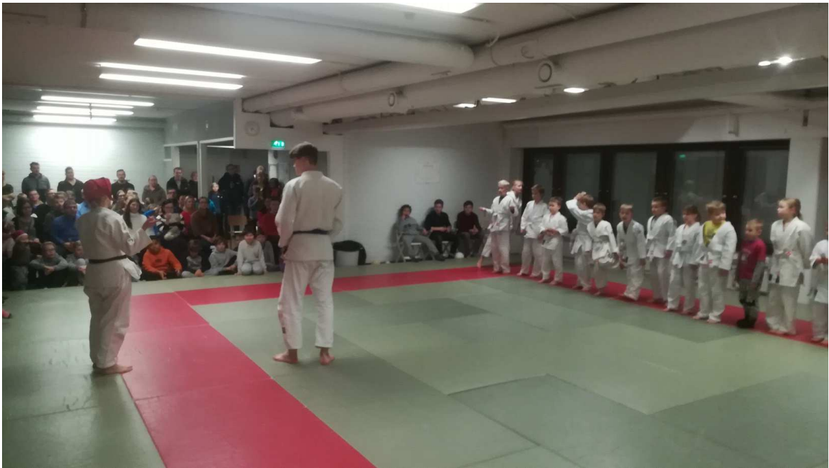
Katsomo seuraava junioreiden esitystä