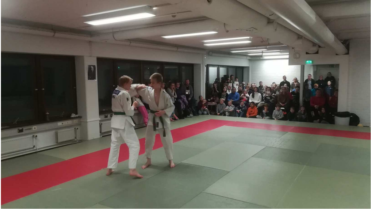
Vanhemmat juniorit näyttävät ottelemista