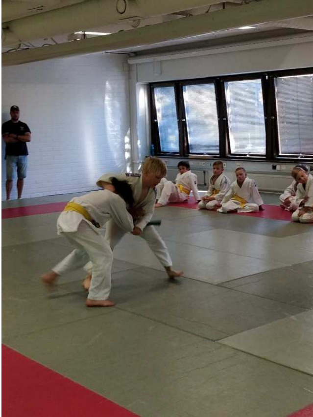
Sali kisoissa ottelemista