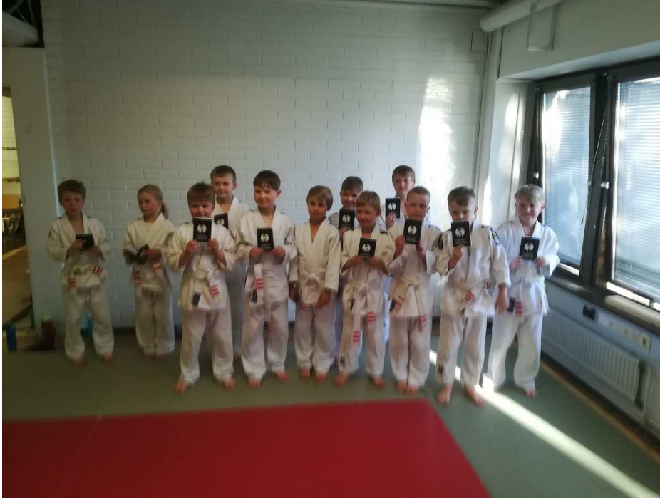
Peruskurssi 1 juuri vyökokeiden jälkeen

Onnittelut vielä kaikille uusien vyöarvojen saajille!